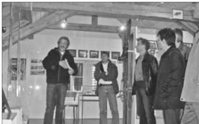
Viele wertvolle Original-Exponate im Regionalmuseum erzählen ihre eigene Geschichte.

SchiLw ist die offizielle Abkürzung für schulhausinterne Lehrerinnen- und Lehrerweiterbildung. Gemäss geltender Verordnung zum Volksschulbildungsgesetz hat jede Schule das Recht und die Verpflichtung, für «SchiLw» pro Jahr fünf Halbtage einzusetzen. An diesen SchiLw-Halbtagen haben die Schülerinnen und Schüler keinen Unterricht. Die Schulpflege kann auf Antrag der Schulleitung auch vier weitere Halbtage bewilligen, die allerdings kompensiert werden müssen.