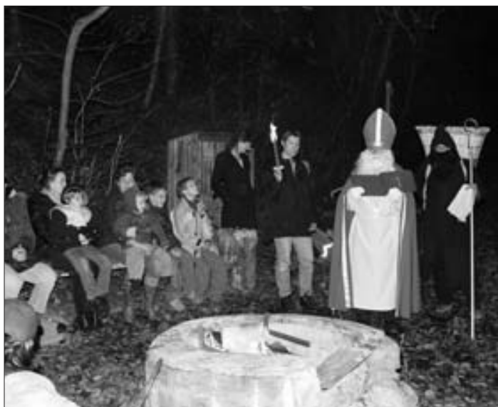
Rund ums wärmende Feuer versammelten sich viele Eltern mit ihren Kindern, um den Samichlaus, welcher aus dem dunklen Wald kam, zu begrüssen.

Hundert kurze und lange Beine von Kindern des Regionalen Chinderhuus Wäggis und ihren Eltern streben voller Erwartung dem Wald entgegen. Die Kleinsten geniessen schlafend, wohlbehütet im Kinderwagen den Ausflug. Am Waldrand laden das Licht von Fackeln und ein grosses Feuer zum Verweilen ein. Wo ist er denn, der grosse Mann im roten Kapuzenmantel? «Da kommt er!», tönt es von allen Seiten. Die Herzen von Gross und Klein pochen lauter und schneller. Der Samichlaus schüttelt alle Hände, freut sich so viele Kinder und Eltern zu treffen. Er weiss vieles zu erzählen von Kindern welche fleissig basteln und malen, grosse Hütten aus Tüchern und Kissen bauen, aber nicht gerne aufräumen. Die Kinder erfreuen den Samichlaus und Knecht Ruprecht mit Liedern und Versen. Sie werden mit einem grossen Sack Mandarinen, Schöggeli und Grit-