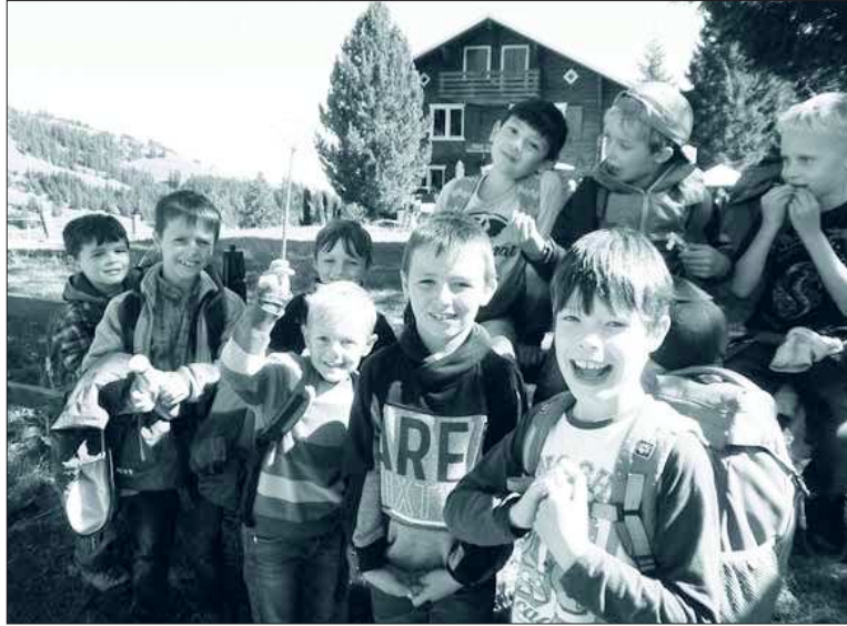
Zwischenhalt in der Sonne.

Von Rigi Kaltbad ging es dann zügig weiter zu Fuss. Wild durcheinander wanderten die beiden 1. und 2. Klassen mit einem kurzen Zwischenhalt bis zur Rasthütte Un-