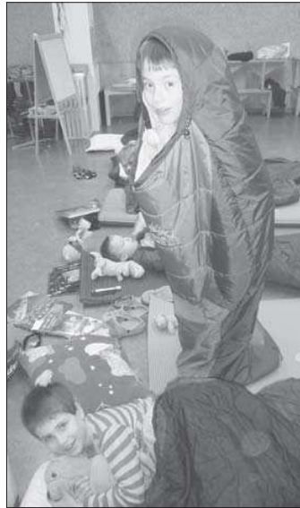
Wie geht der Schlafsack am besten zu?