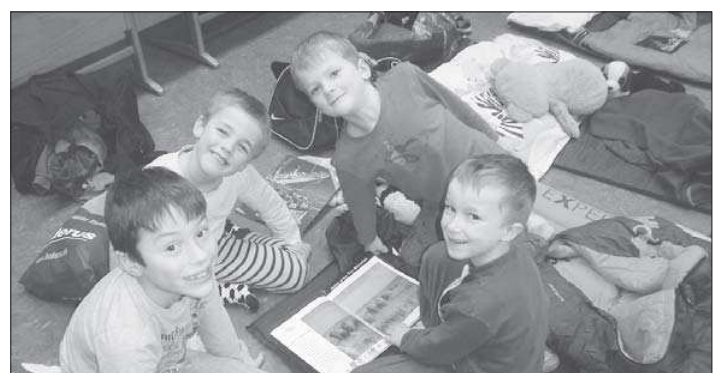
Da gibt es viel Spannendes zu entdecken.