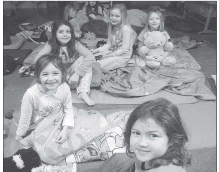
Gerade erst aufgewacht ...