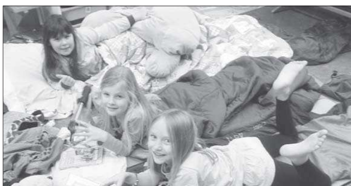
Unsere Kuschtiere mussten natürlich auch mit.