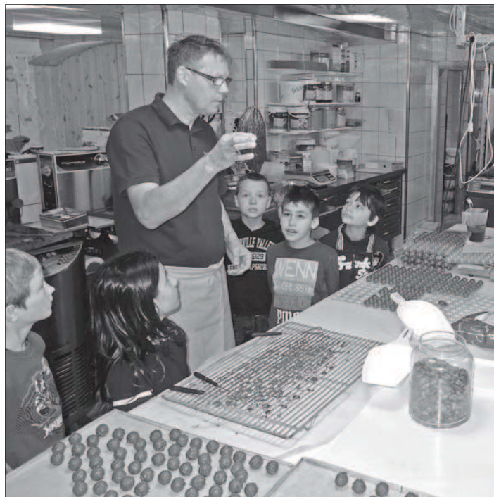
Gebannte Blicke auf die Kakaoschote aus Südamerika.