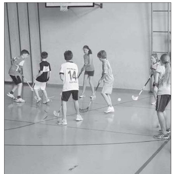
Hier ist eine gute Technik gefragt.