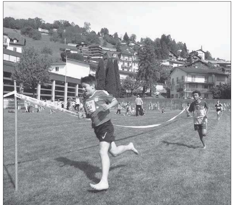
Barfuss auf dem Dauerlauf.