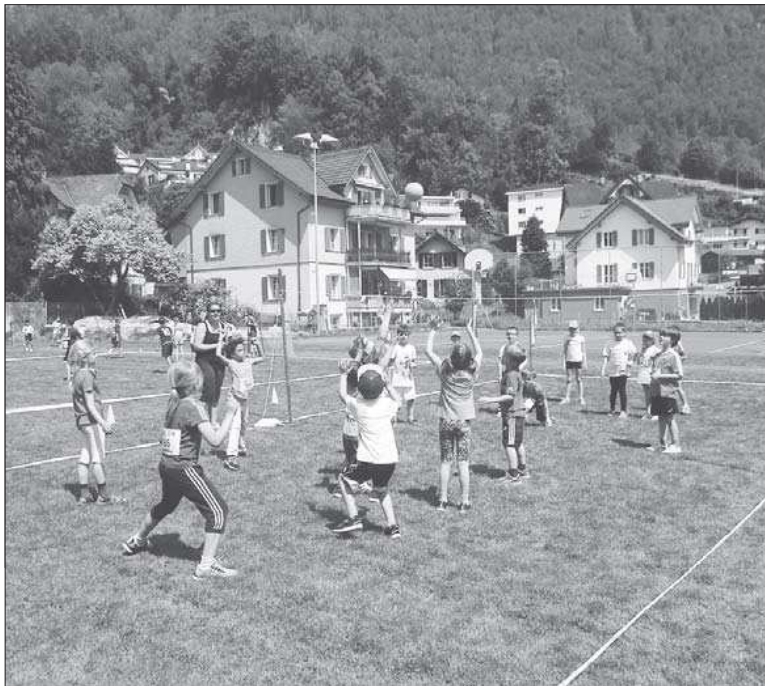
Schnell fangen, sonst fällt der Ball zu Boden!