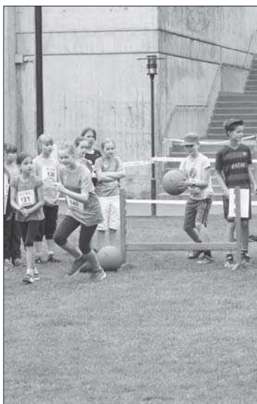
Warum heissen die Medizinbälle eigentlich Medizinbälle?