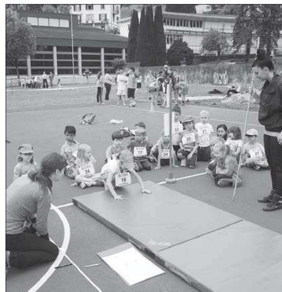
Aus der Kauerstellung so weit hüpfen wie ein Frosch.