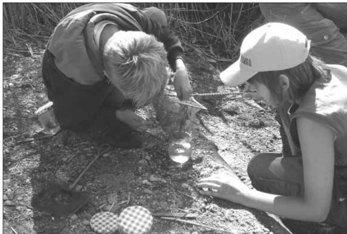
Ein Weggiser Forschungsteam an der Arbeit.

Beim nächsten Posten musste unsere Klasse einen Wettlauf über Inseln, Brücken, Steine und Seile gegen eine andere Klasse machen. Danach durften wir miteinander picknicken. Nach dem Mittagessen spürten wir Insekten, Spinnen und Fische auf. Weiter gingen wir zu einem Tipi. Dort konnten wir selber Kohle herstellen und mit Blättern ein Naturbild gestalten. Am Schluss mussten wir uns beeilen, um den Zug noch zu erwischen. Kurz gesagt: Es war für uns alle ein tolles Erlebnis.