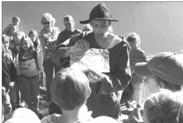
Was wird da alles angeschwemmt im Delta? Eine Schatzkarte lässt uns die Antworten finden.