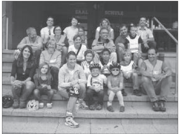
Das Velofahrkurs-Gruppenbild vom Samstag, 5. September 2009.

Die Verkehrspolizei hat im Juni 2009 den Verkehrsgarten in Vitz-