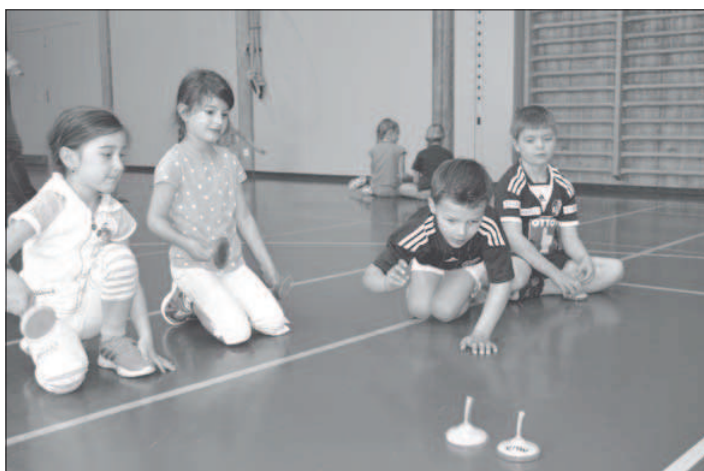
Bei diesen Spiel-Stöckli stand der Spass im Vordergrund.