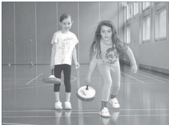
Auch den Zielwettbewerb fanden die Kinder cool.

Auch beim zweiten Besuch nach drei Wochen wurden wir von den Kids herzlich empfangen. Wir warteten mit neuen Attraktionen auf die Schüler wie zum Beispiel das