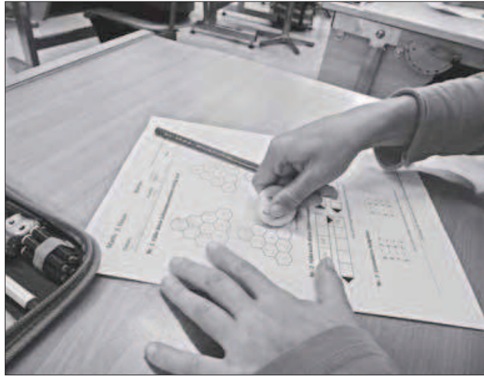
Schon wird wieder gerechnet und geschrieben: Das Schuljahr 2014/15 begann für die Weggiser Klassen bereits am 11. August.

Die Förderung erfolgt in den Regelklassen durch IF- bzw. IS-Lehrpersonen.