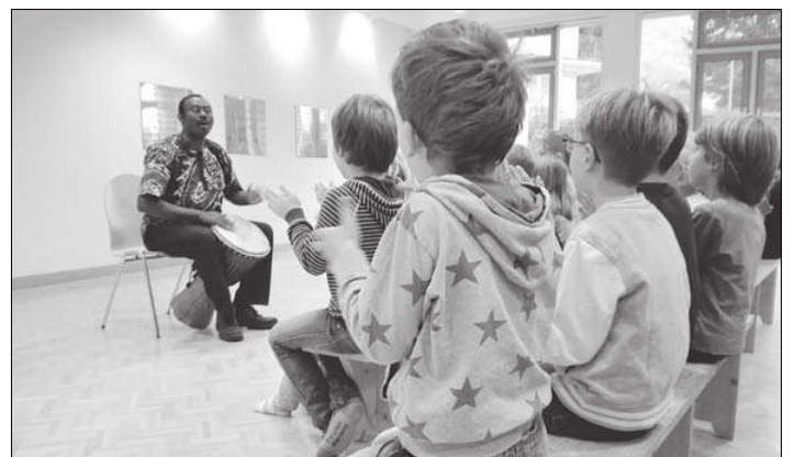
Rhythmus und Tanz gehören in Ghana zu jeder Geschichte.