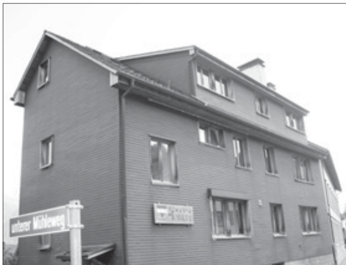
Lagerhaus Torkel, Oberschan

...die Schulreise Am Donnerstag hatten wir die Schulreise. Wir fuhren mit dem Bus nach Sargans, um