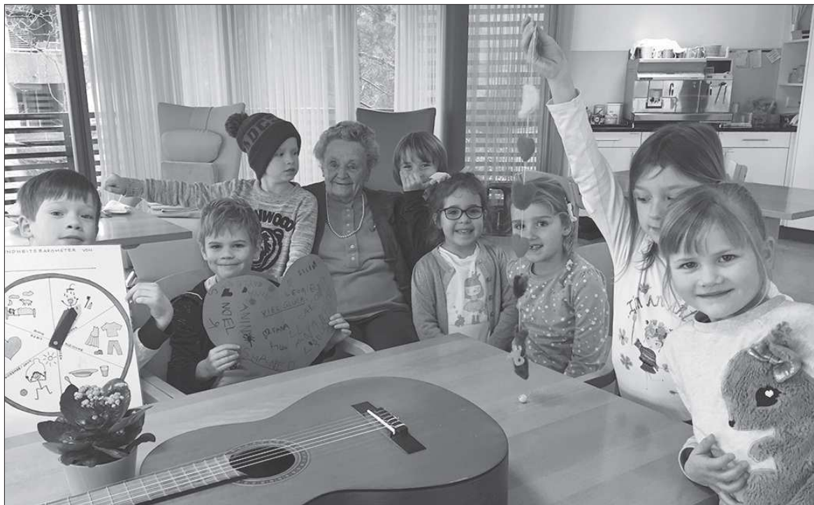
Besuch im Alterszentrum Hofmatt.

suchten Miggeli im Alterszentrum Hofmatt und fragten sie, was sie für ihre Gesundheit tut. «Nicht faul werden, jeden Tag turnen und sich ein feines Essen gönnen», antwortete sie uns humorvoll. Und schon stand Miggeli auf und turnte uns ganz locker einige Hampelmänner vor. Bravo, das nehmen wir uns zum Vorbild. Wir wünschen Miggeli und auch Ihnen, liebe Leserinnen und Leser, weiterhin gute Gesundheit.