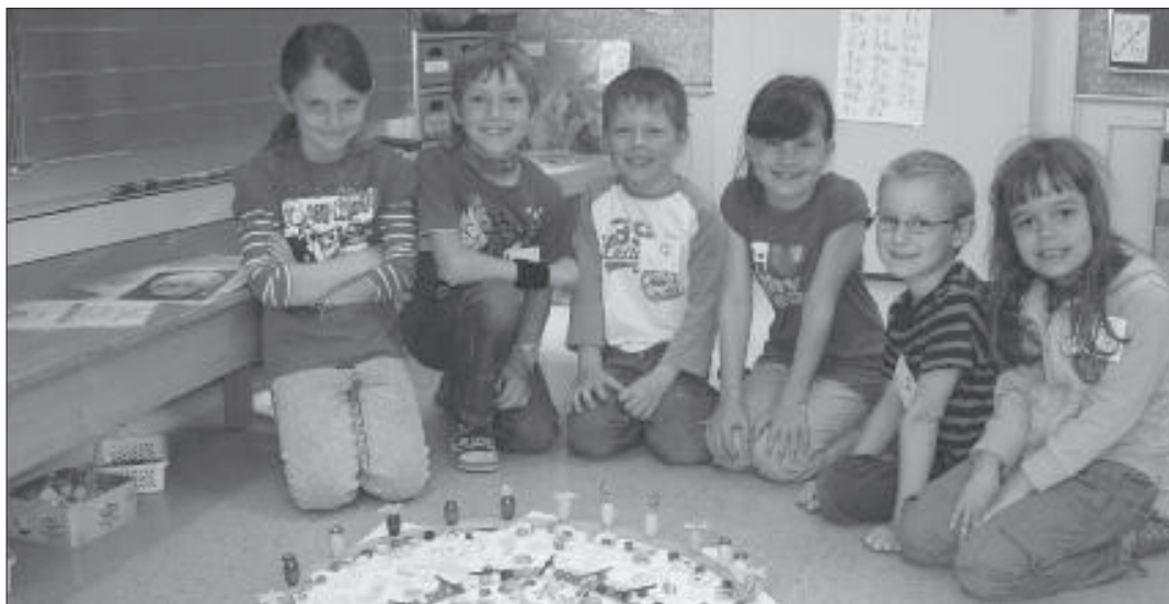
Die Schülerinnen und Schüler gestalteten im «Sehen-Atelier» ein grosses Mandala.

Als Abschluss der Projektwoche führten die Kinder einander kleine Theater vor. In jedem der selbst einstudierten Theater traf man auf mindestens einen der fünf Sinne. So ging eine lehrreiche Woche äusserst unterhaltsam zu Ende.