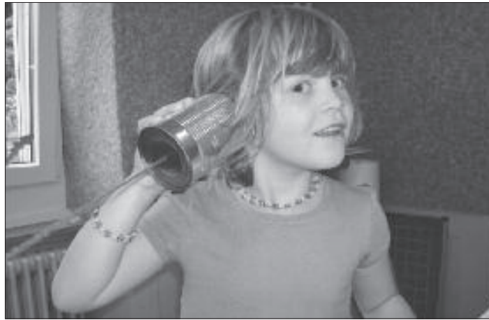
Wer spricht wohl am anderen Ende? Die Kommunikation per Dosentelefon ist der Hit!

Im «Sehen-Atelier» begegneten die Schülerinnen und Schüler optischen Täuschungen. Sie bastelten selber einen Kreisel, der die Augen täuscht. Ein Schüler berichtet: «Wir nahmen einen Bierdeckel und malten auf die eine Seite einen Käfig und auf die andere Seite einen Papagei. Nachher machten wir Schnüre daran. Wenn man es aufdreht, ist der Papagei im Käfig.»