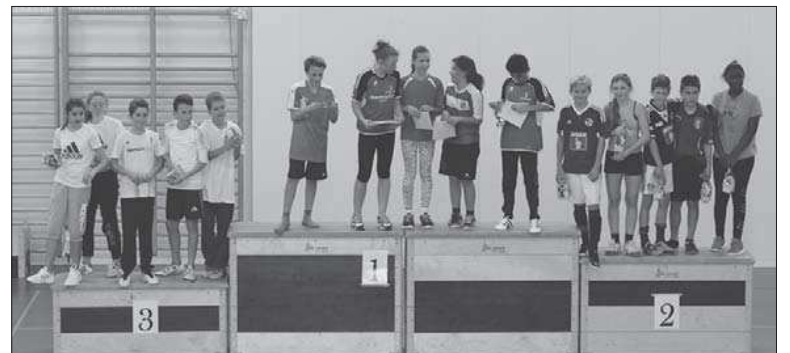
1. Platz: Greppner, 2. Platz: Milchbubis, 3. Platz: Adidas.

Pünktlich um 15.40 Uhr erfolgte der Abpfiff und ein sportlicher Nachmittag mit tollem Einsatz der Spielenden, die rücksichtsvoll und mit Freude spielten, ging zu Ende. Belohnt wurden die Siegerteams einerseits mit prall gefüllten Chlaus-Säckli, andererseits mit Pausenkiosk-Bons. Die Stufensiegerteams erhielten die begehrten Wanderpokale. Anschliessend strömten die Jugendlichen mit Freude ins verdiente Wochenende. Im Dörfli freut man sich bereits auf den nächstjährigen Chlaus-Cup.