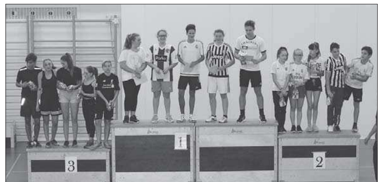
1. Platz: RoViLuSch, 2. Platz: Guete Bueb, 3. Platz: Aaröndlis.