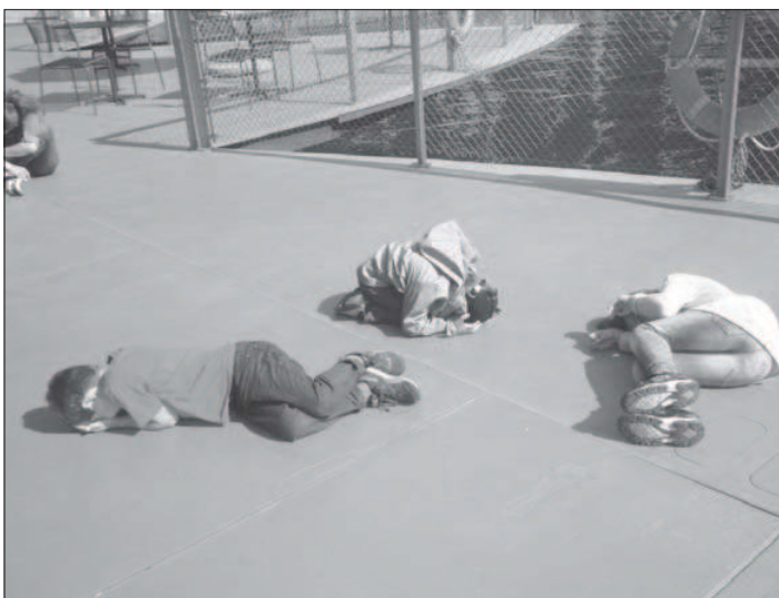
Wie die Samenkörner...