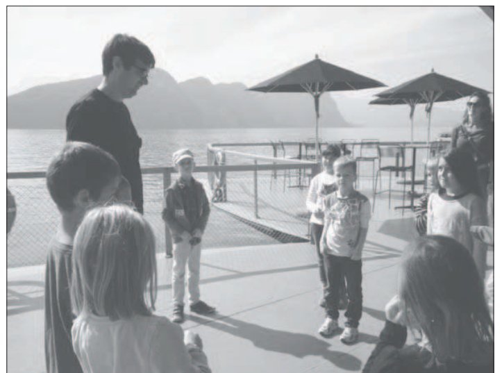
...oder fest verwurzelte Bäume.