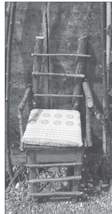
Bequem und einzigartig, Werk der 2. Klässler.